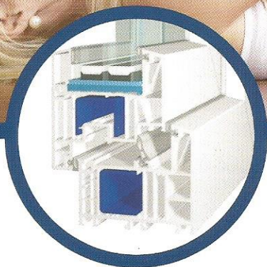
bluEvolution: 82 MD