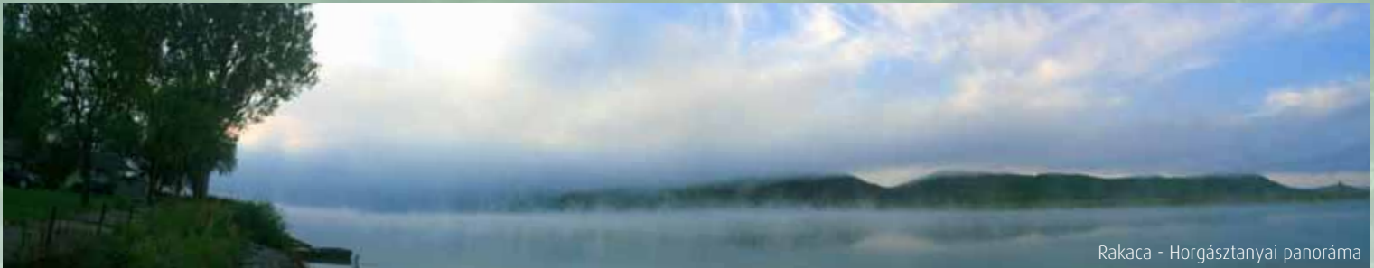
Rakaca - Horgásztanyai panoráma

Szeretettel várunk minden tagunkat a Rakacai-tó partján lévő horgásztanyánkra. Szobafoglalás az egyesület irodájában. Tel.: 46/354-500