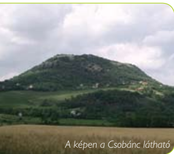
A képen a Csobánc látható